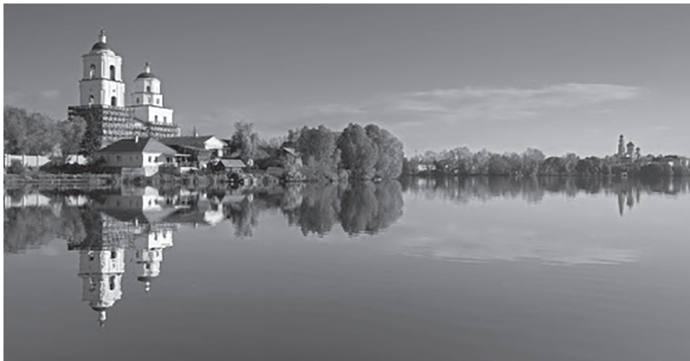
Городской пруд и два храма.