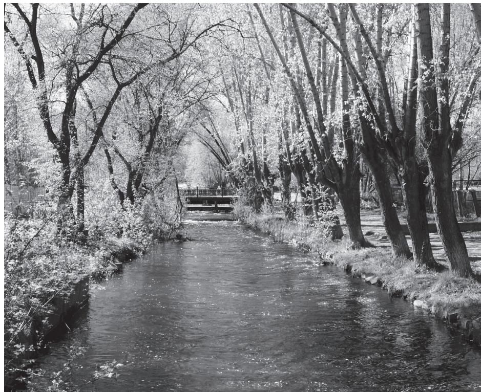
Русло речки Кыштымки.