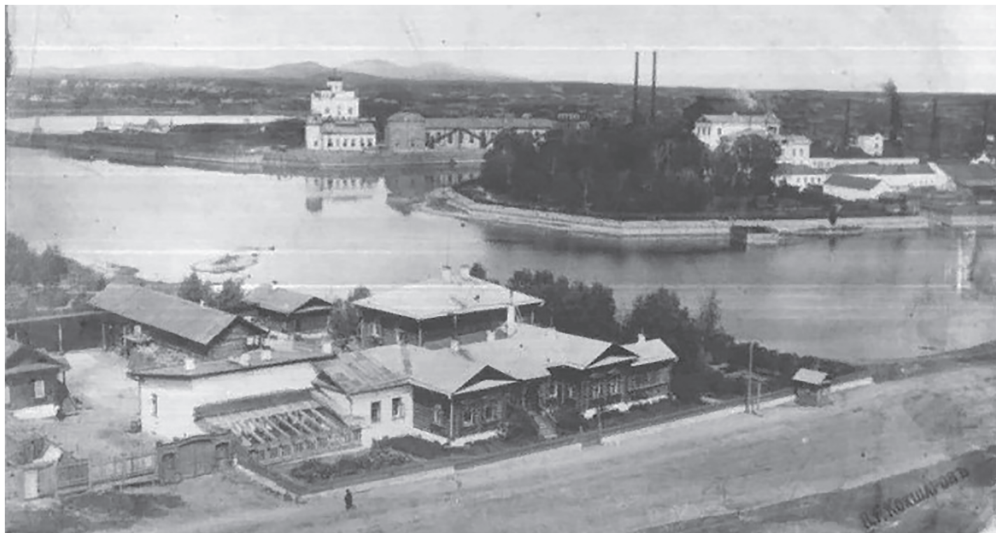
Вид на дом Дружинина с колокольни Святодухосошествиевской церкви. 1900-е годы.

Окна декорированы массивными резными наличниками в традиционном русском стиле. Под кровлей протянут резной карниз. Фигурные балясины, поддерживающие крышу, повторяют стиль оконных наличников. В декоре наличников и крыльца использованы точёные элементы с крупными членениями,